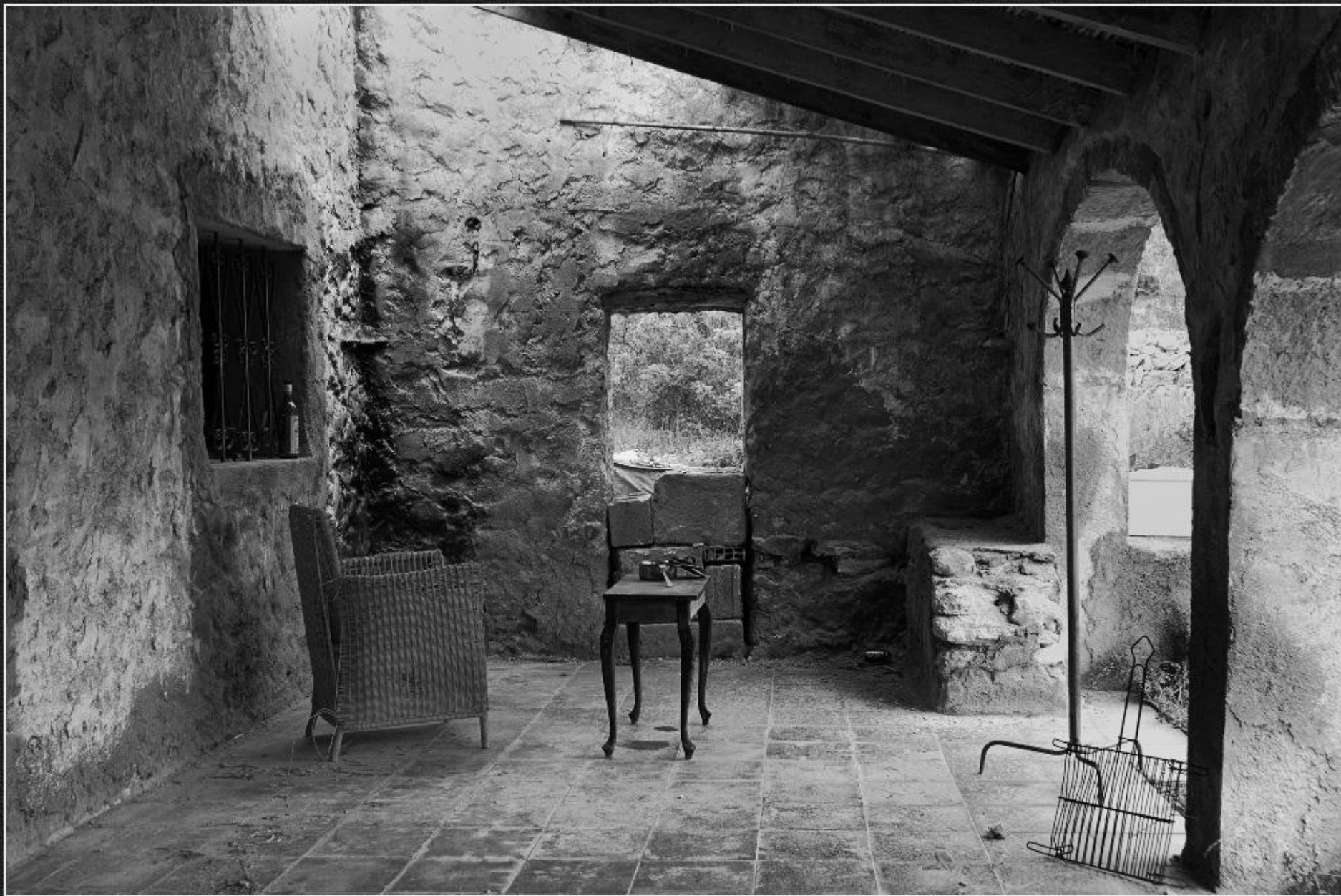
Interior riurau del Mosso - El Rifalet