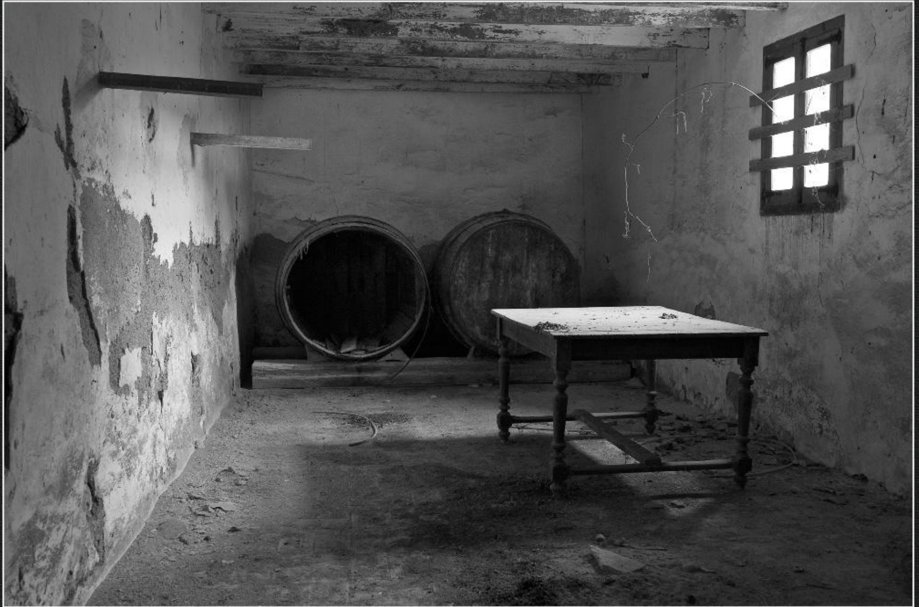
Botes i taula. Riurau de la Pegolina - La Lluça