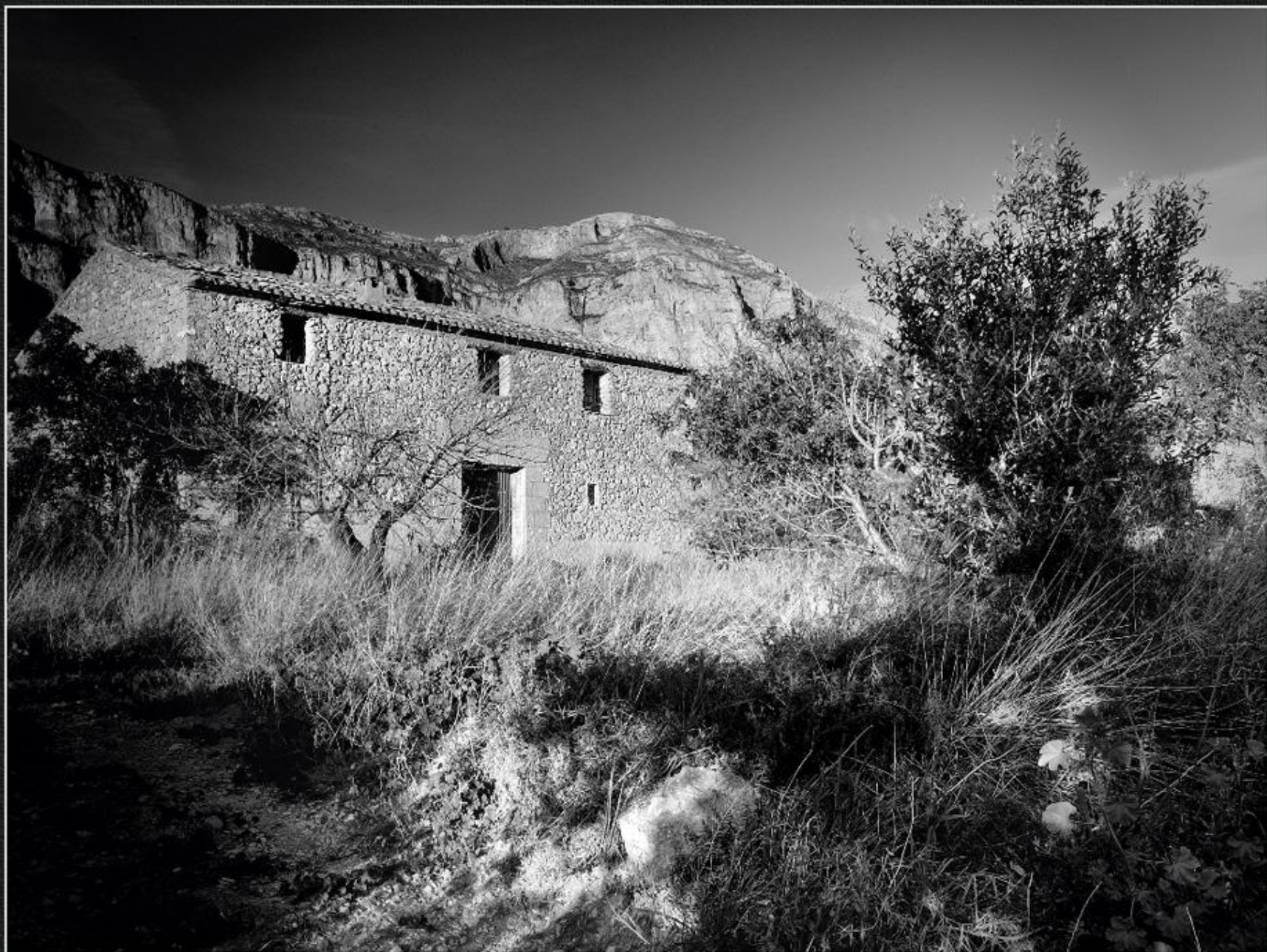
Alqueria - Les Valls