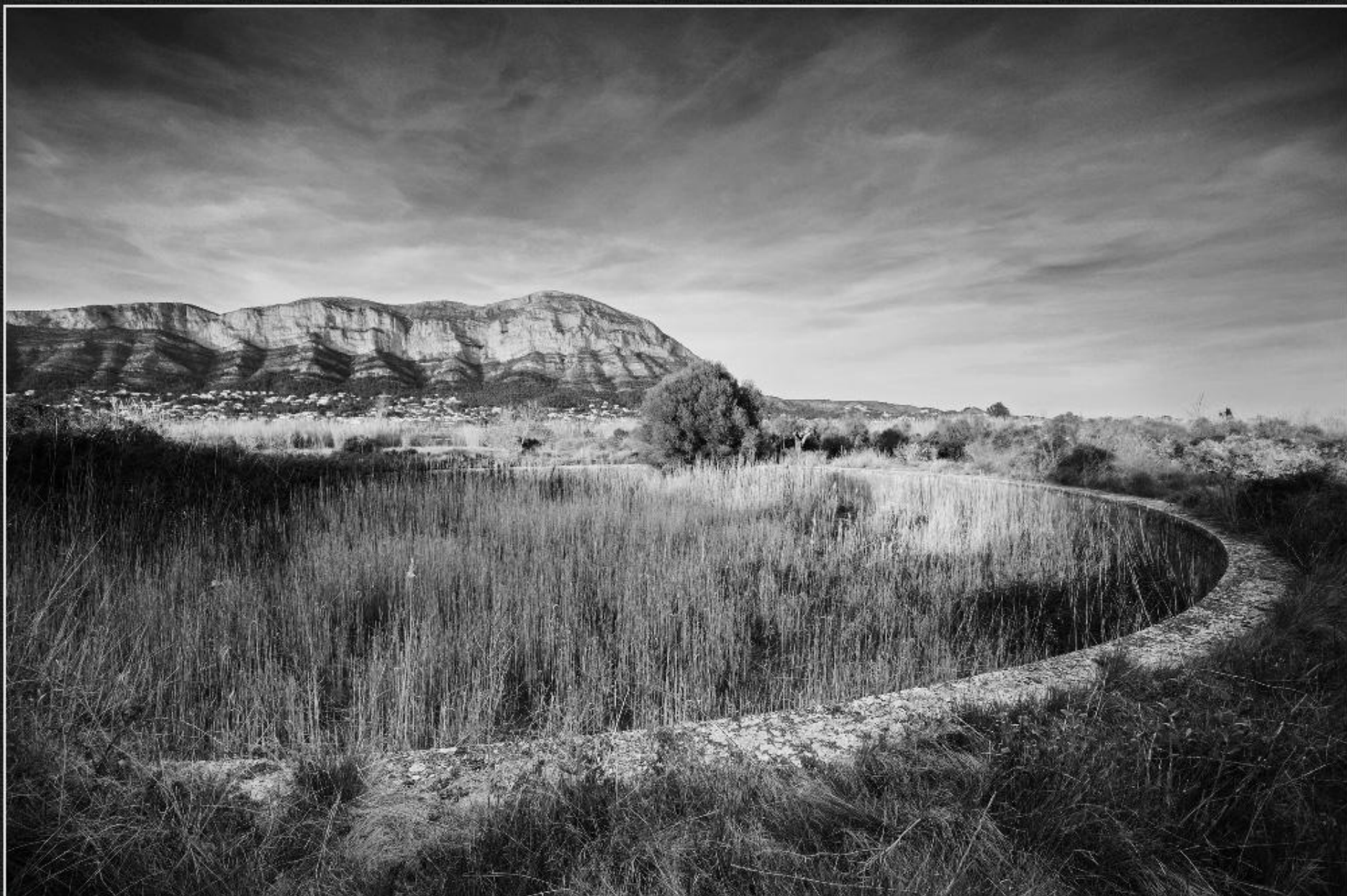
Bassa de Bolufer - Els Julians