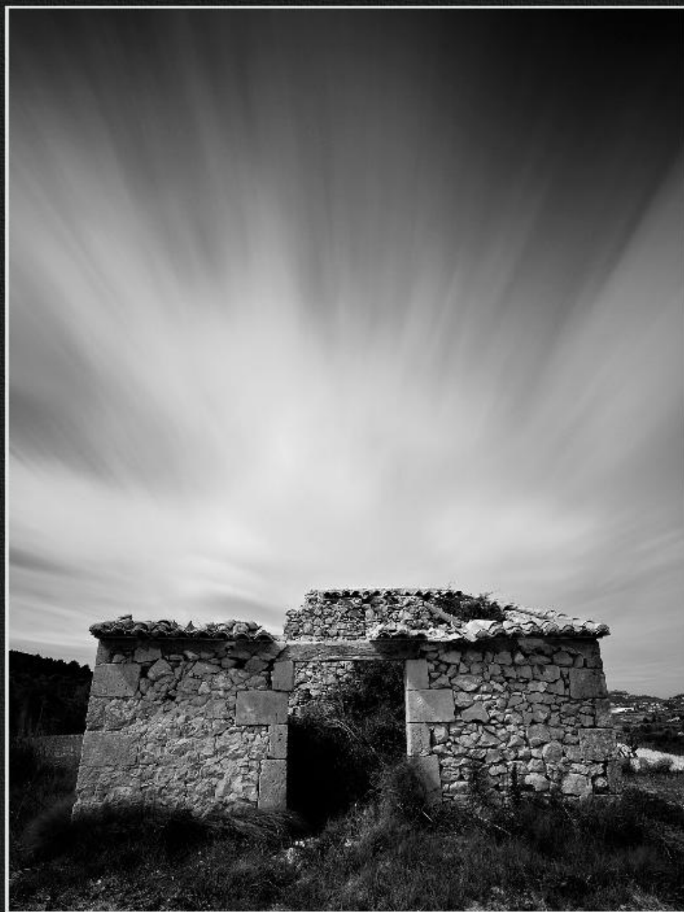
Frontera casup - La Tarraula