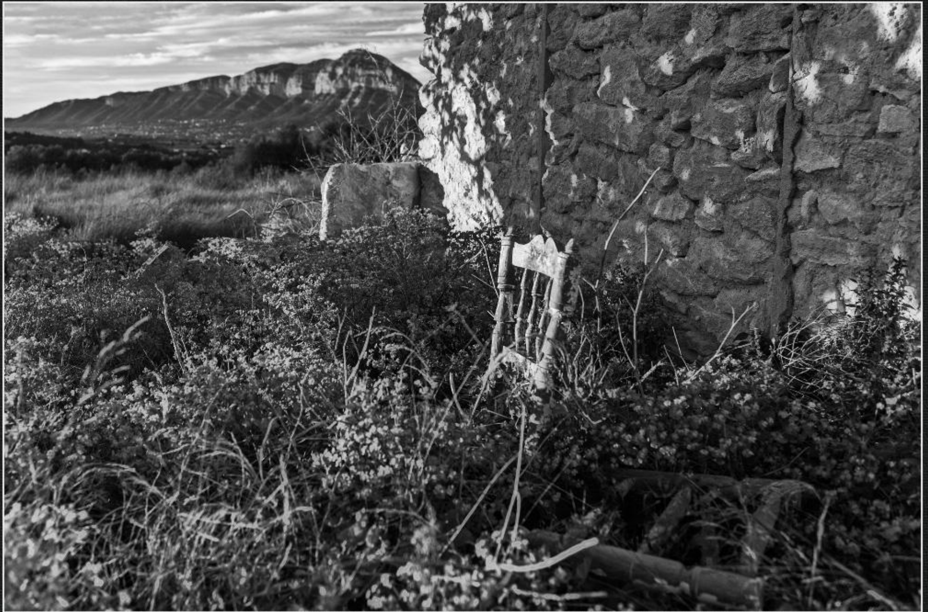
Casup Cansalades