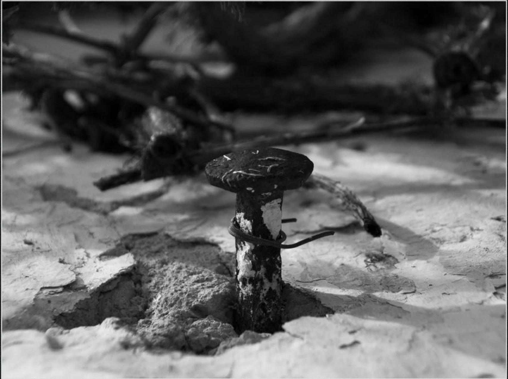
Detall casup de Cap de Martí