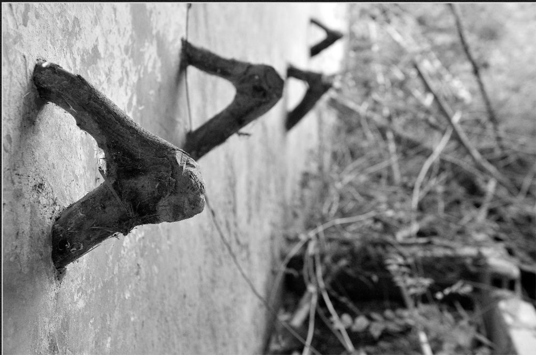
Estaques i pessebre. Caseta i bassa de Terra Soler - La Lluça