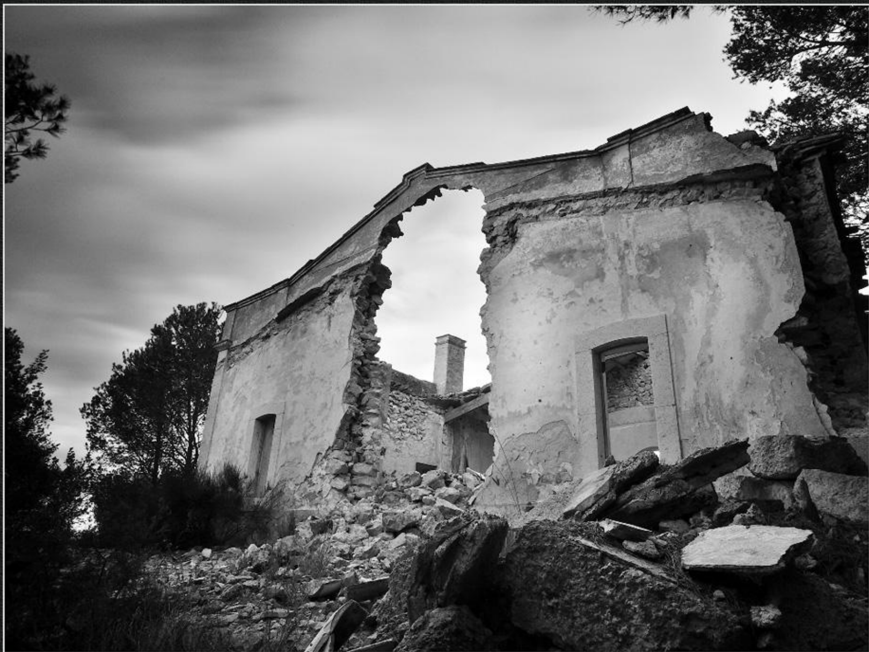
Casa de les Memes - La Plana