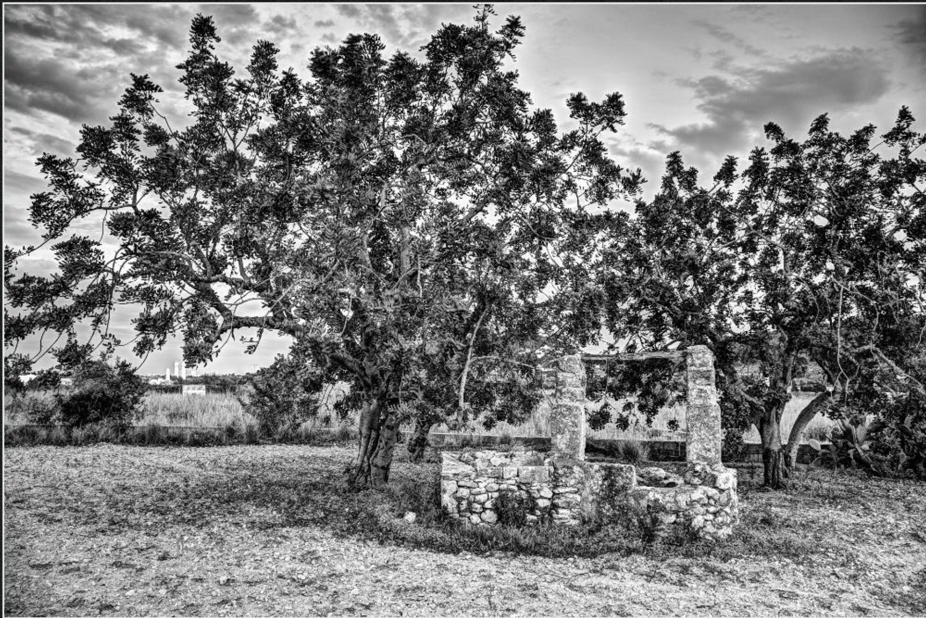
Pou i safreig. Riurau del Clot de Larion - La Riba