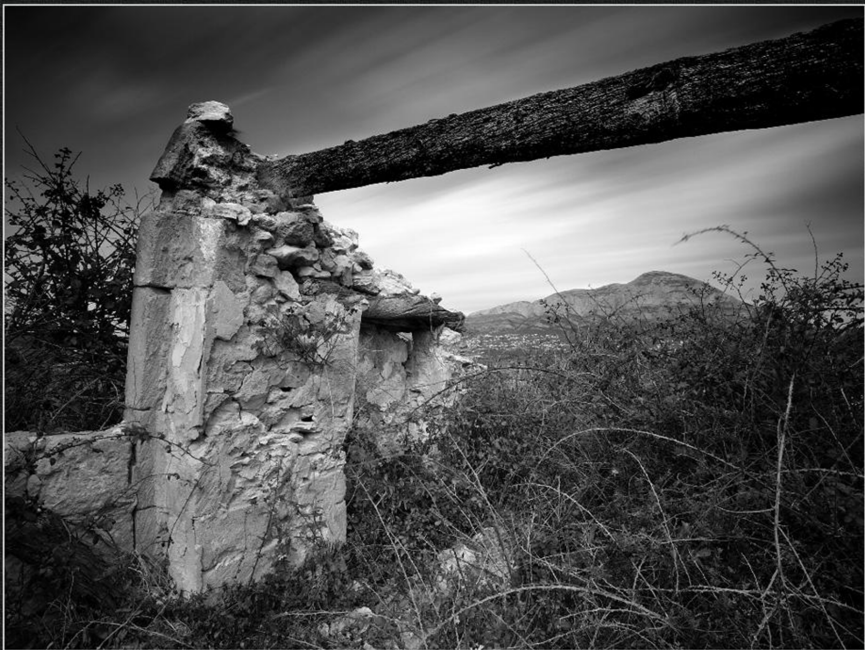
Jässena. Casup - La Tarraula