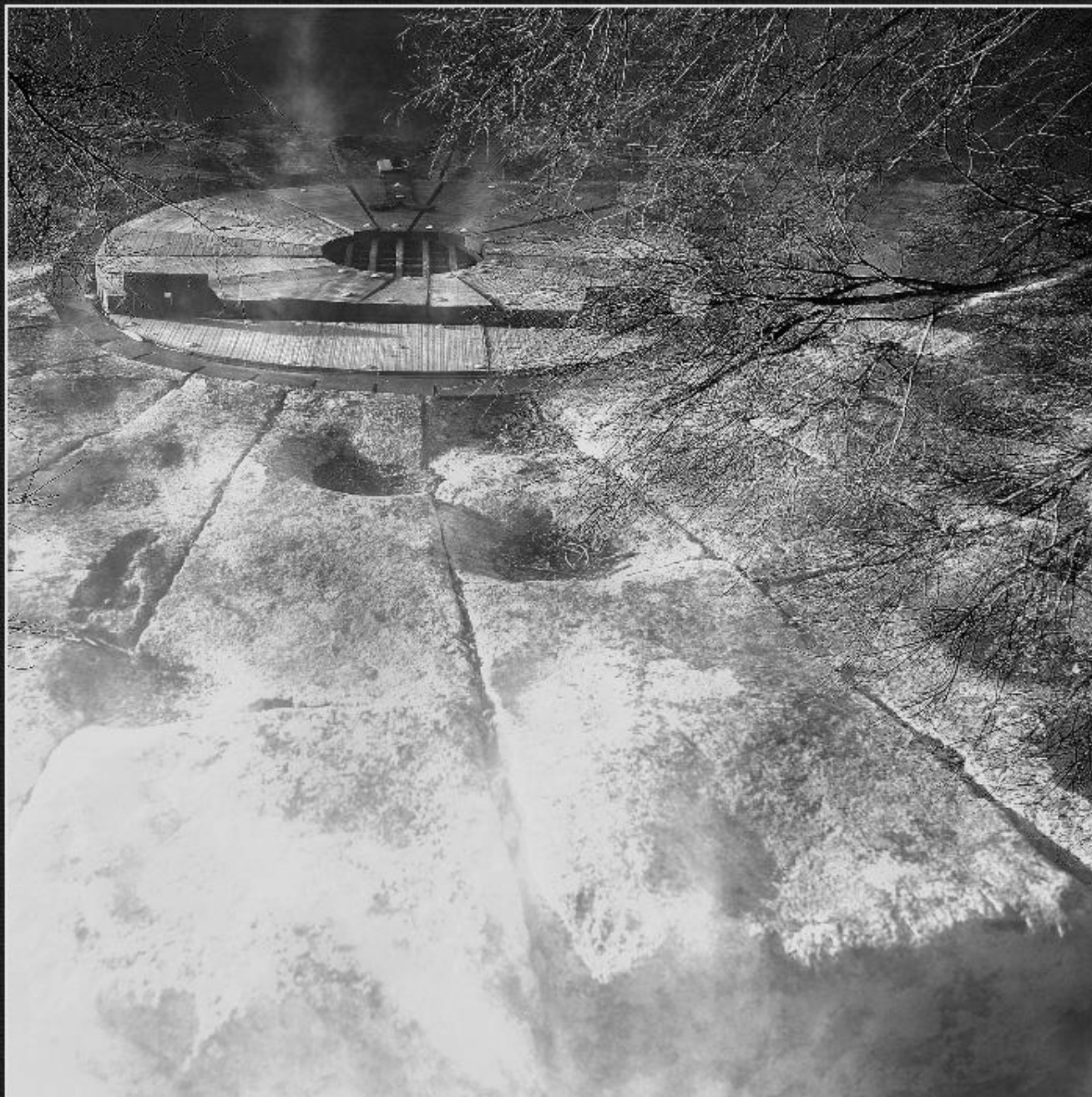
Pou de Castells - Senioles