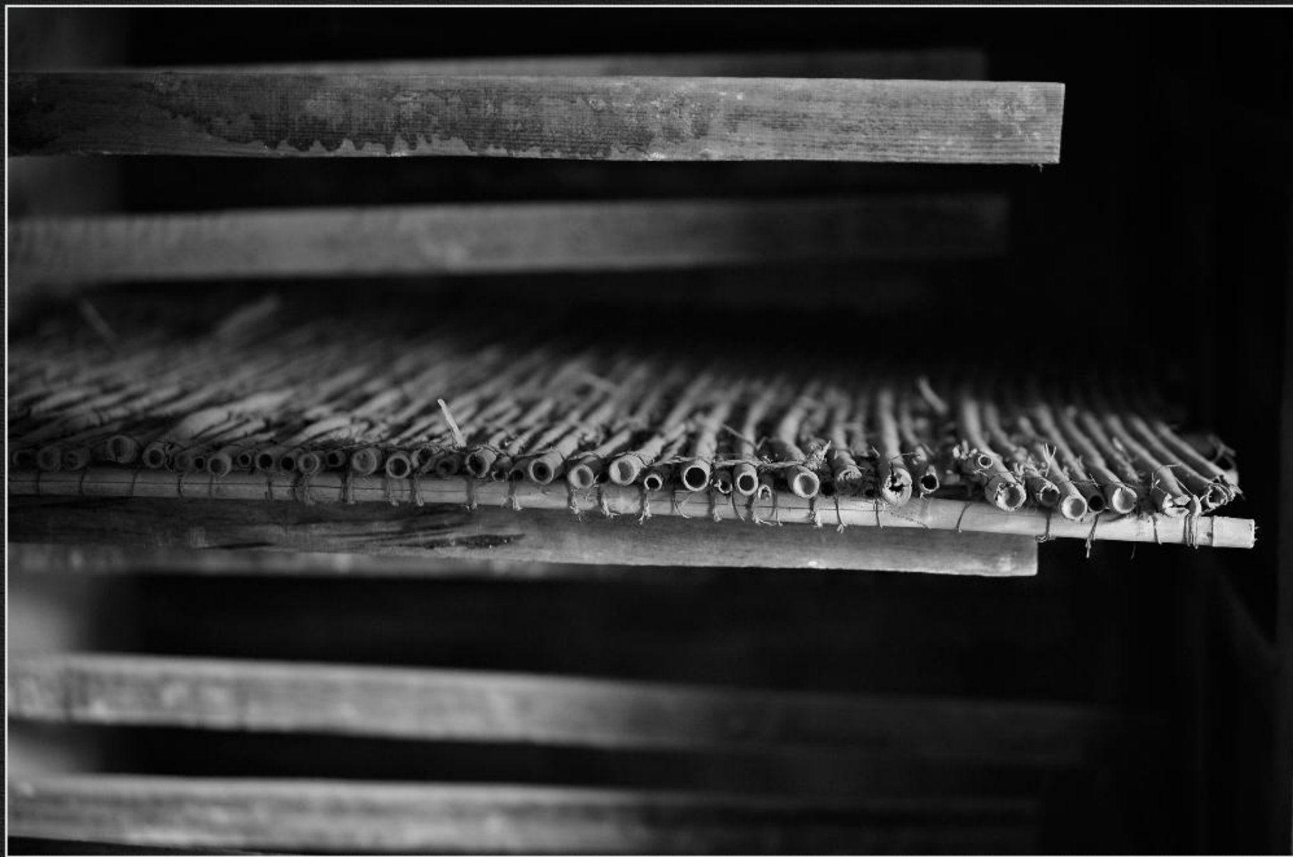
Estaques i canyissos. Estufa de la caseta dels Gostinos - La Lluça