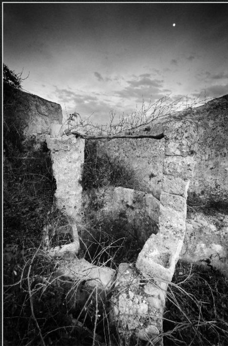
Cup del molí de Climent - Les Barranqueres