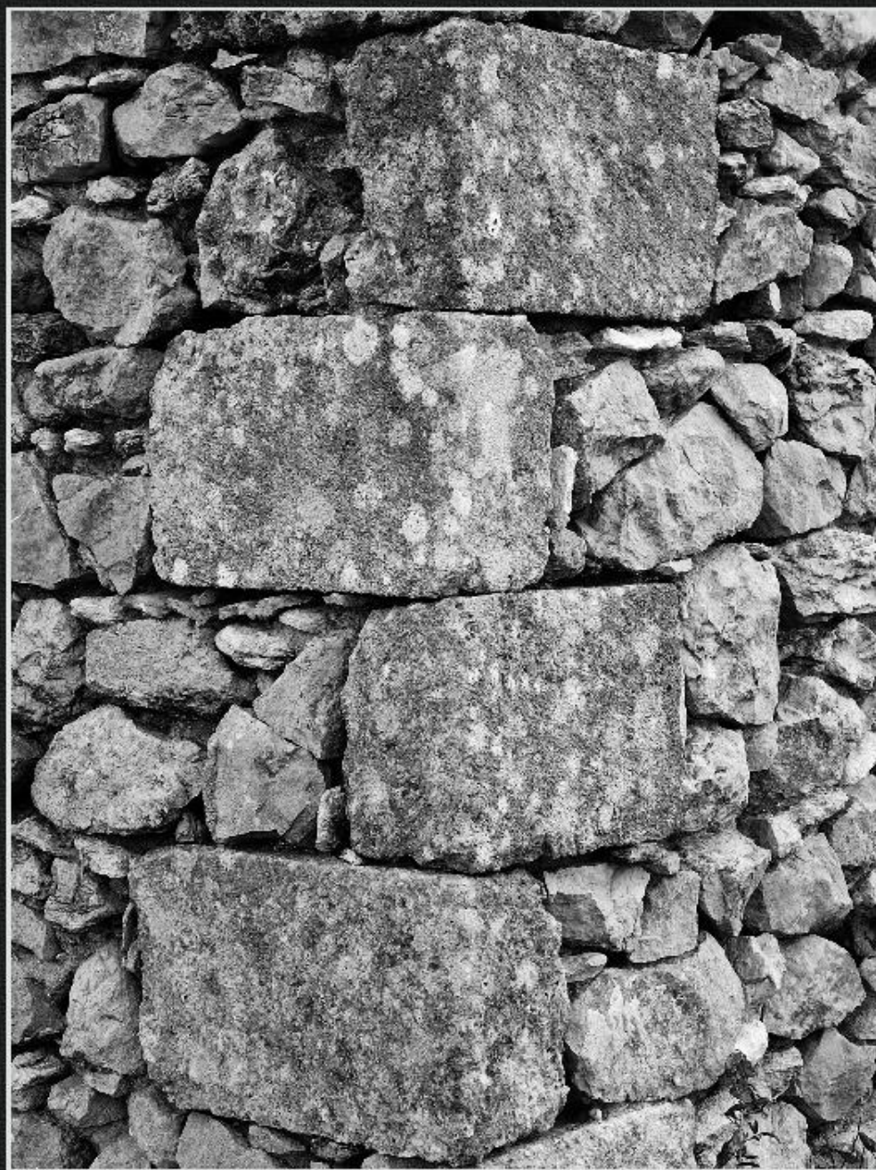
Cantonera de tosques casup - La Tarraula