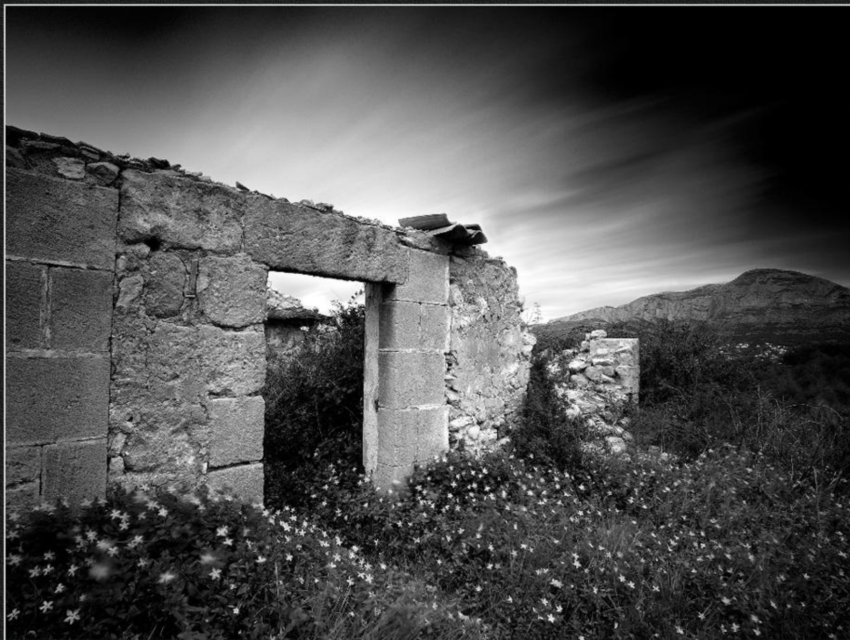
Brancalada de fosques. Casup - La Tarraula